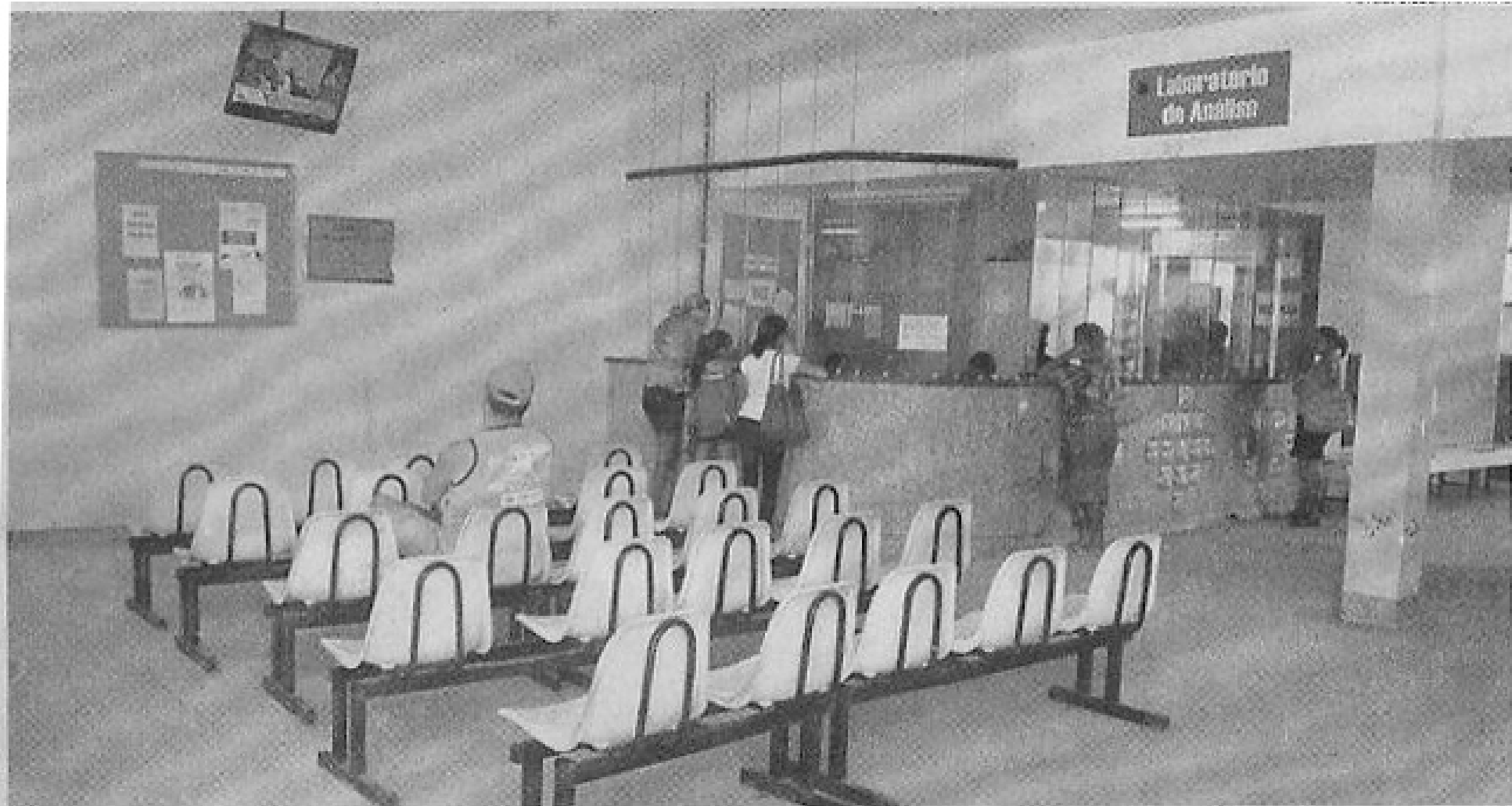
O laboratório do Hospital Universitário, que normalmente atende em média 300 pessoas por dia, com a greve quase não registra movimento

ALERTA. Hospital Universitário também teve atendimentos afetados