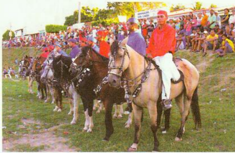
De cima para baixo, pastoril, disputa entre CSA e CRB e cavalhada

A oposição cromática entre vermelho e azul está presente na bandeira de Alagoas, em alguns folgedos populares e no uniforme do CSA e do CRB