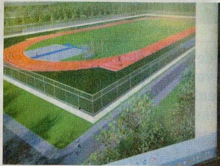
Planta do estádio olímpico, apresentada pela Ufal durante a reunião com o ministro

verno federal em parceria com a Secretaria Nacional de Esporte e os comitês Olímpico e Paralímpico brasileiros, que contempla, também, outras universidades federais em diversos Estados brasileiros.