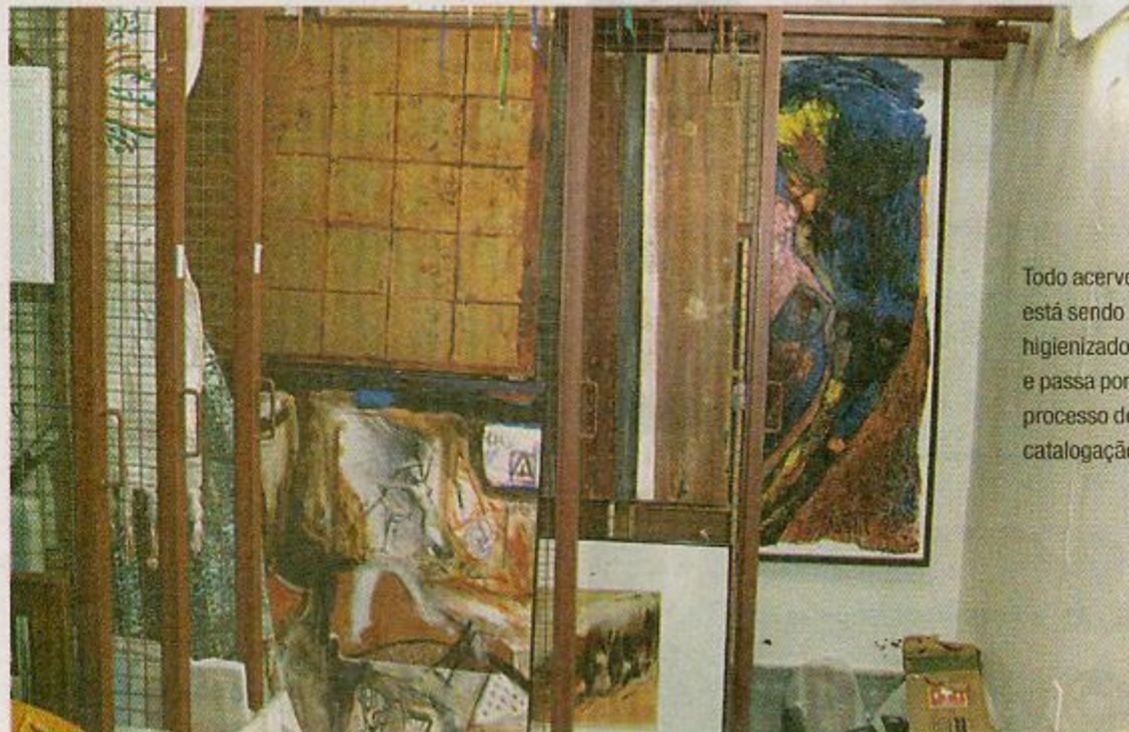
Todo acervo está sendo higienizado e passa por processo de catalogação

Acervo que conta a história de três décadas da Pinacoteca Universitária está sendo preparado para ser apresentado aos artistas alagoanos e apreciadores de arte em exposição de longa duração, prevista para o início de 2013. Com mais de uma centena de peças, entre esculturas, videoarte, objetos tridimensionais e pinturas, a Reserva Técnica da casa foi visitada por O Jornal e é assunto desta edição