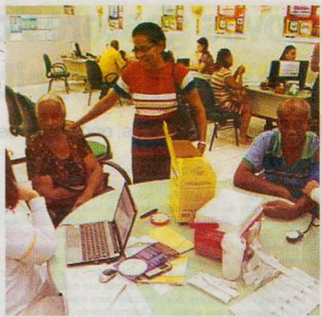
Ação foi realizada pela Coopeal junto aos associados da Federalcred