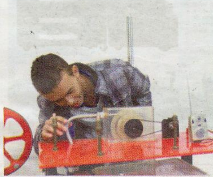
Miniusina Hidrelétrica: projeto dos alunos de Física da Ufal junto à Usina Ciência