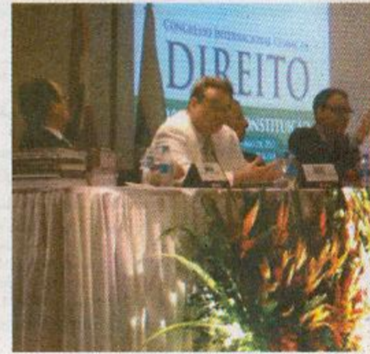
Palestrantes da Alemanha debateram o Direito Internacional