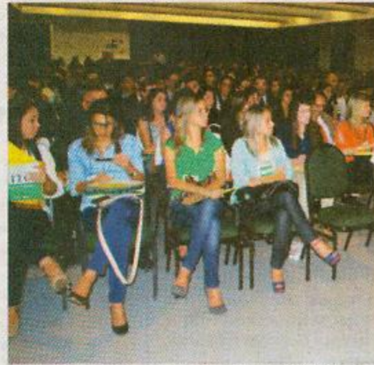
Auditório lotado de estudantes do CESMAC e de...