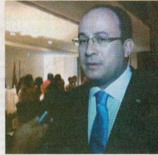
... presença do presidente da OAB/AL, Thiago Bonfim