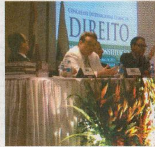
Palestrantes da Alemanha debateram o Direito Internacional