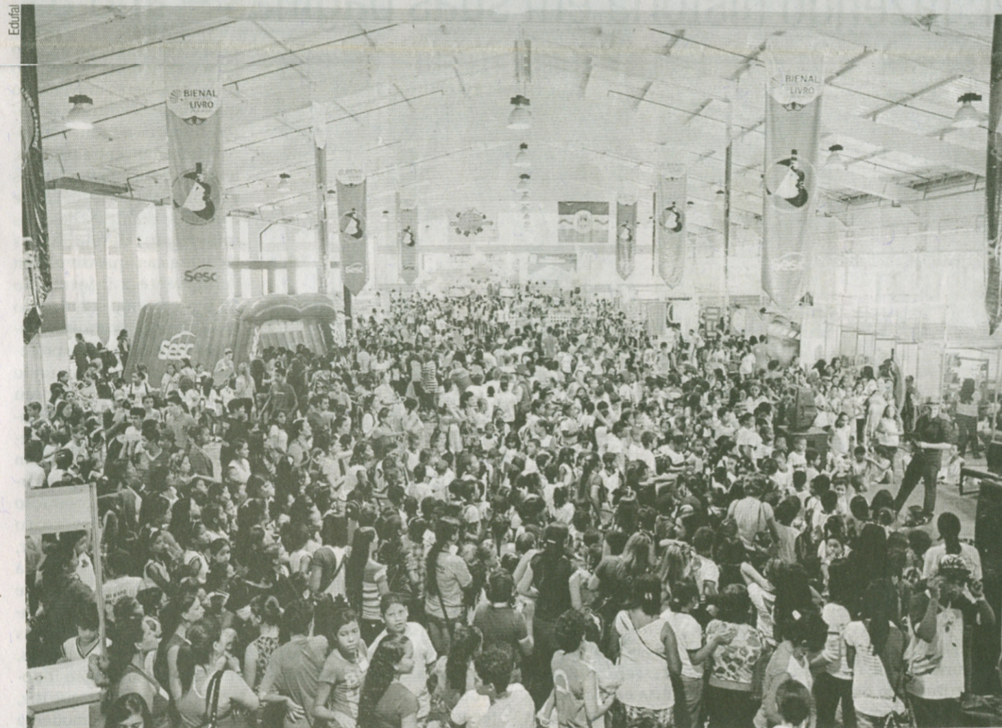
6ª Bienal Internacional do Livro de Alagoas, em 2013

Campus A. C. Simões, outubro 2014 Luiz Sávio de Almeida