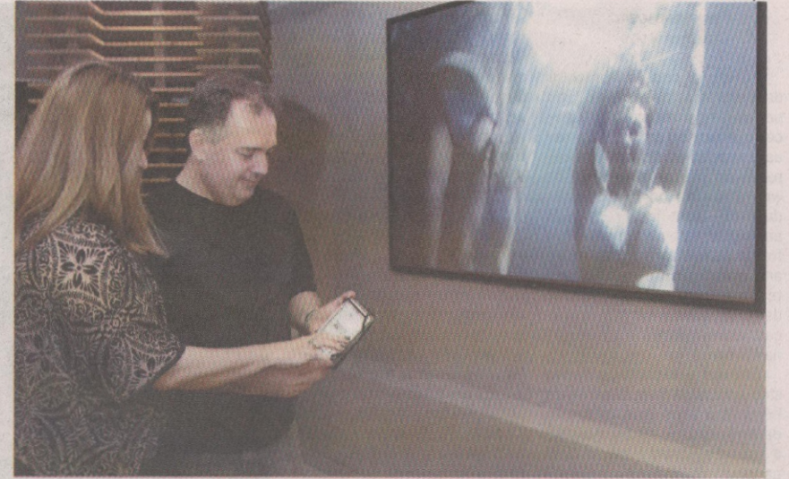
Por meio de um smartphone, tablet ou computador, o consumidor pode ter o controle total de sua casa

* Sob supervisão da Editora da Gazeta de Alagoas