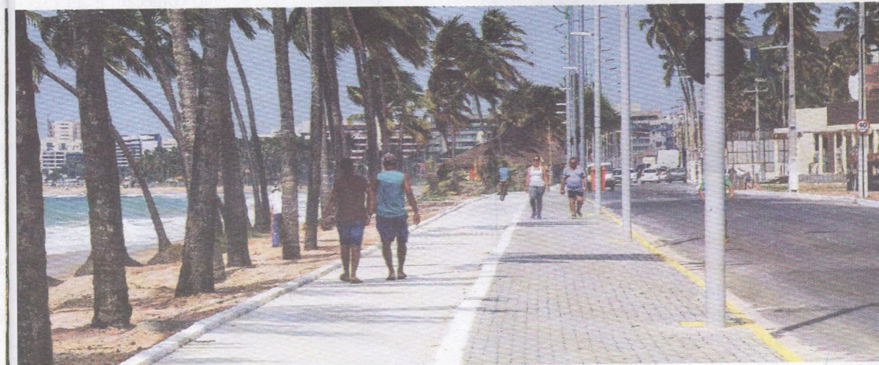
A via litorânea Pontes de Miranda vai desafogar o tráfego na Avenida Gustavo Paiva, no Litoral Norte

portância da obra, que contou com a parceria da instituição. "Cedemos ao Município a área para construção de um conjunto de obras, entre elas a pavimentação e drenagem da Paulo Holanda. Os serviços realizados trouxeram segurança, saneamento e iluminação. A comunidade da Universidade agradece e se coloca de forma propositiva para dar continuidade a estas parcerias que trazem benefícios", disse o reitor.