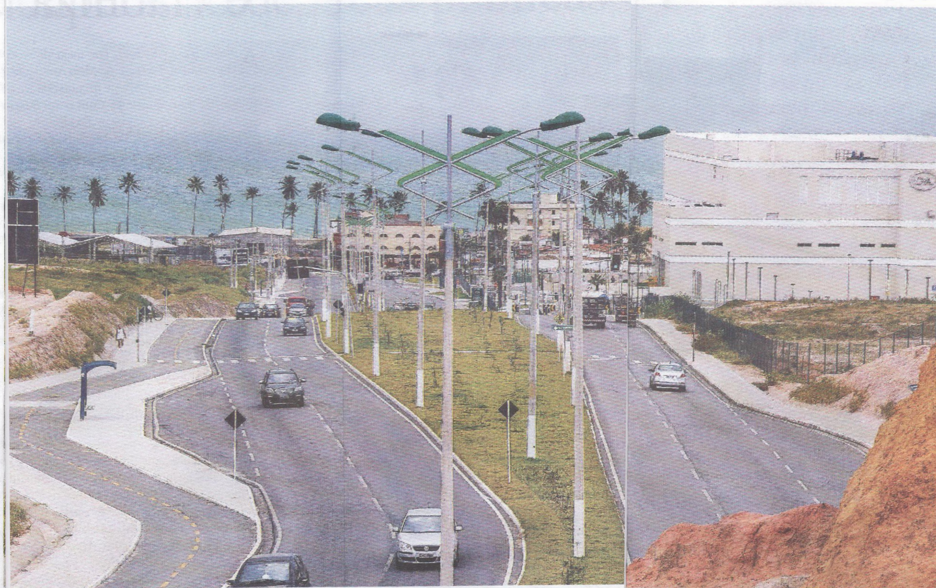
A construção da Avenida Josepha de Melo, que liga a Cruz das Almas ao Barro Duro, promove a integração entre o litoral norte e bairros da parte alta

No Benedito Bentes, a população do Conjunto Luiz Pedro III comemora a pavimentação e drenagem de 40 ruas. A obra foi entregue no mês de outubro, com investimento em recursos próprios da Prefeitura, provenientes do recolhimento de impostos. As ruas também receberam os serviços de iluminação executados pela Superintendência Municipal de Energia e Iluminação Pública (Sima) e de sinalização, feitos pela Superintendência Municipal de Transportes e Trânsito (SMTT).