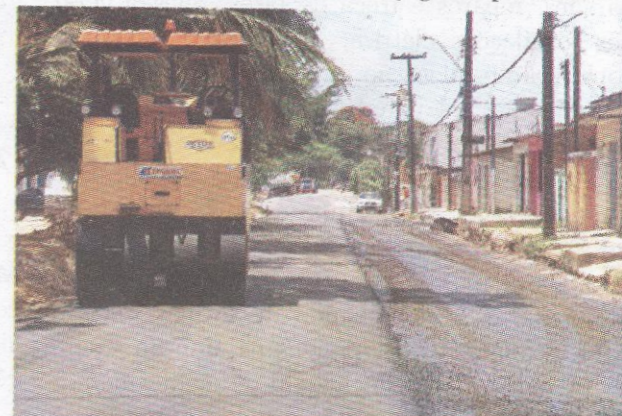
Novas vias mudam estrutura na Santa Lúcia