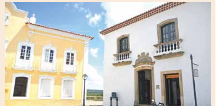
Restaurante Forte Maurício de Nassau (dir.) ao lado da Prefeitura

Quem visitou Penedo, Alagoas, para a reunião da SBEEL, pode apreciar a beleza da cidade histórica, sua culinária e seu artesanato