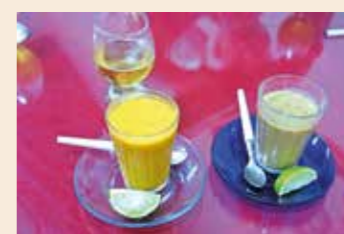
Os caldinhos de camarão e feijão